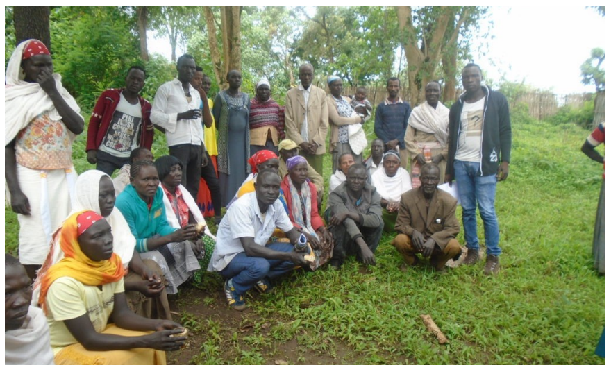
Kurs for menn og kvinner i miljøbevissthet