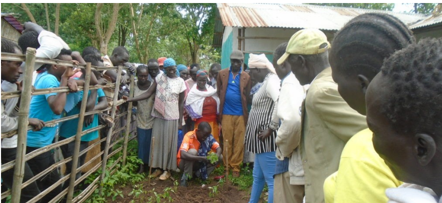
Bønder får opplæring i hvordan man planter, høster og tilbereder grønnsaker

Her nede finner du bilder fra kurs for bønder i bl.a. birøkt, planting av trær, massemobilisering om miljø og mange andre spennende aktiviteter!