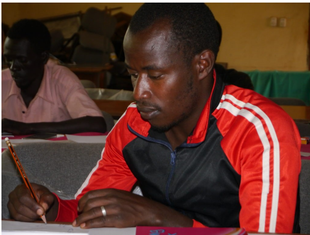
Mawiya har allerede illustrert en del før, og var en av de mer erfarne tegnerne i workshopen

- I vårt samfunn blir vi ikke oppfordret til å drive med kunst og tegne illustrasjoner. Men vi har en vakker kultur og et fint land-