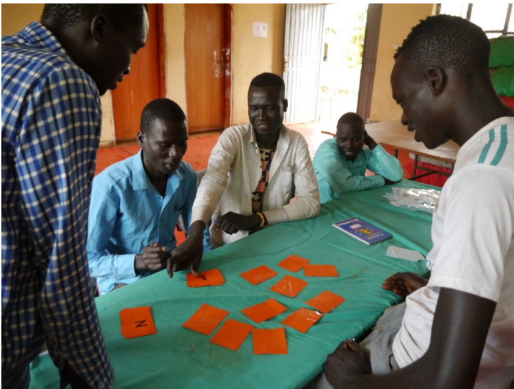
Deltakerne sorterer alfabetkort

Mao Komo prosjektet har allerede utstyrt fire landsbyer med et landsbybibliotek og en bibliotekar som tar vare på bøkene som har blitt produsert i prosjektet. Hver måned skriver de rapporter om hva de gjør med barna som kommer for å lese, og hvilke aktiviteter de gjør med dem. Materiellet som vi produserte i denne workshopen skal blant annet brukes i landsbybibliotekene.