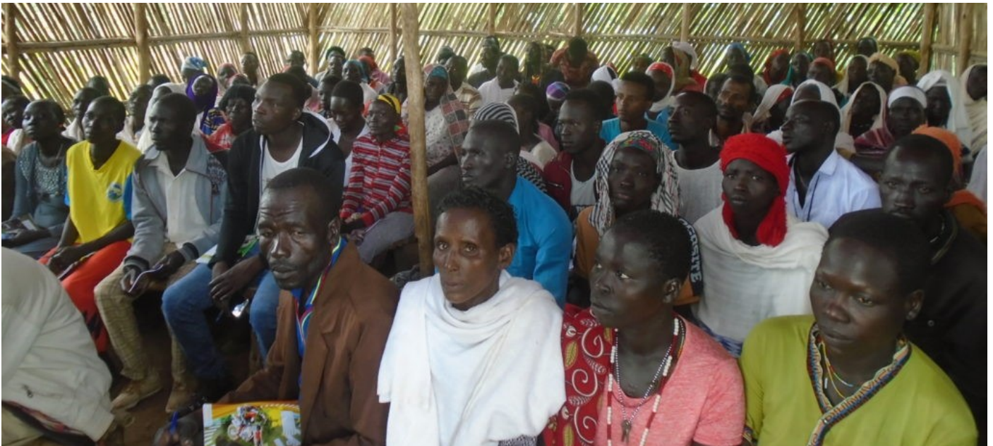
Massemobilisering om sparing og oppretting av egen business for menn og kvinner. Kvinnene skal organiseres i låne- og spare-grupper

Yaso posjektområde er det nyeste området i landsbyutviklingsprosjektet Green LiP. Selv om området har vært preget av veldig mye uroligheter har de likevel begynt med mange spennende aktiviteter.