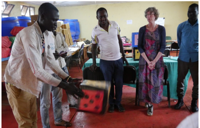
Spill med terning laget av en pappeske

Siste dagen begynte vi også å bruke kortene til å lage historier. Først lagde vi en kort historie med bildekortene, og deretter fant vi riktig ord til bildene slik at vi allerede hadde alle viktige stikkordene for å skrive historien. Vi skal ikke se bort ifra at det kommer noen artige historier fra disse skolene i fremtiden!