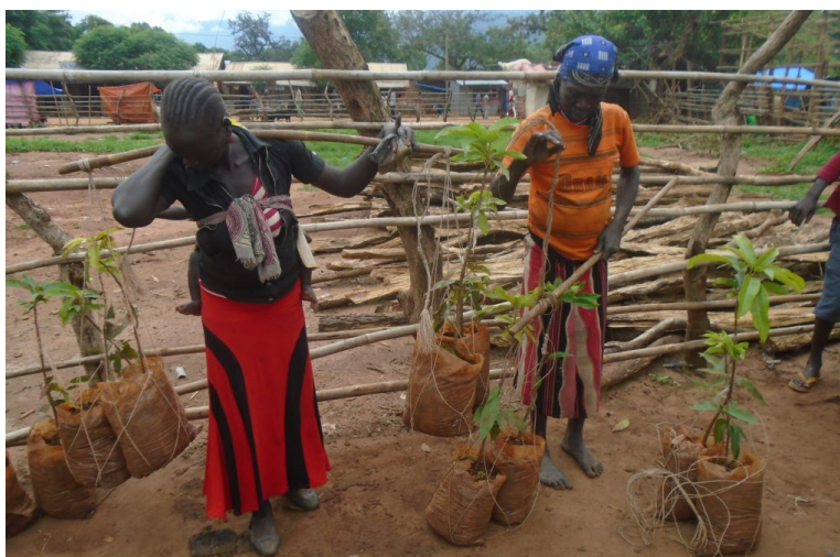
Trær til utplanting fraktes på den tradisjonelle måten. Lokalbefolkningen er aktivt med på alle aktiviteter og bidrar med transport