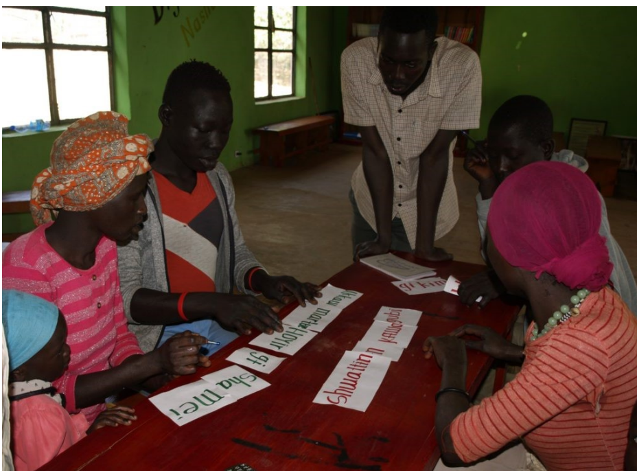
Ord blir til setninger. Morsmåls-alfabetisering på Gwama

Mao Komo arbeidet foregår i det stille. I hele 2018 har det vært uroligheter og etniske spenninger i området, og det fortelles om overgrep og fordrivelse, spesielt i Oromia, hvor arbeidet med minoriteter er forbudt. Så her gjelder det å gå varsomt frem. Flertallet i området er muslimer, og de kristne kirkene har ikke noe godt rykte; evangeliseringen oppfattes som aggressiv og lite sensitiv.