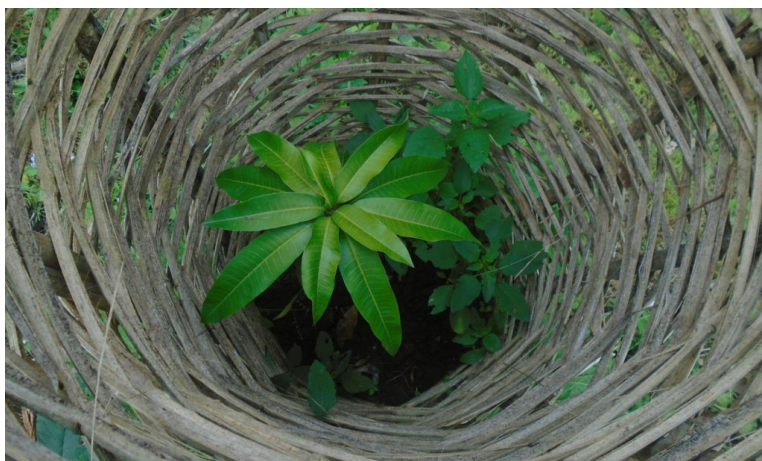
Mange hundre mangotrær har blitt plantet